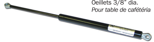
SB-P001 Cylindre pneumatique Oeillets 3/8" dia. Pour table de cafétéria