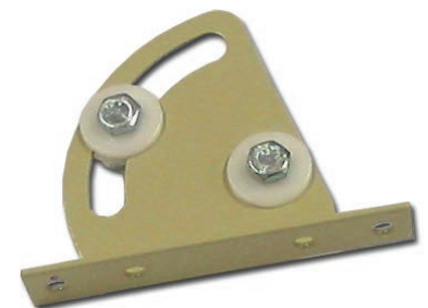
14-P004 Amortisseur de dessus plastique Pour pupitre série 14