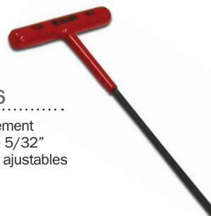
14-P006 Clé d'ajustement Hexagonale 5/32" Pour pattes ajustables