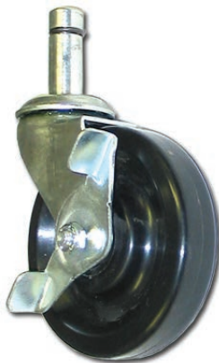
SB-P005 Roue barrante de 4" dia. Tige mâle de 5/8" dia. Pour table de cafétéria