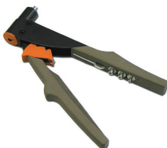
POP-PL30 Riveteuse manuelle pour rivet Pop 3/32", 1/8", 5/32" et 3/16"