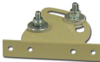
14-P002 / 14-P003 Mécanisme de retenue Pour pupitre série 14