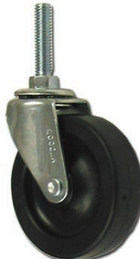
FT-P001 Roue de 3" dia. Tige avec filets 3/8" Pour table série FT