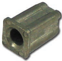
SB-P002 Adapteur de roue Pour tube carré 1 1/4" Pour table de cafétéria