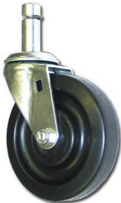
SB-P004 Roue de 4" dia. Tige mâle de 5/8" dia. Pour table de cafétéria