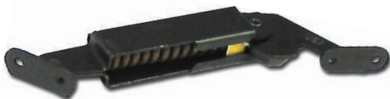
14-P001 Mécanisme de retenue Ancien modèle Pour pupitre série 14