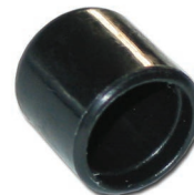
FT-P002 Embout de barrure Tige ronde 1/2" Pour table série FT