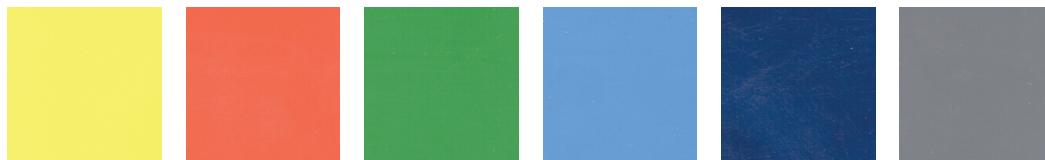
JAUNE (JA) ORANGE (OR) VERT (VE) BLEU (BL) BLEU MARINE (BM) GRIS FONCÉ (GR)