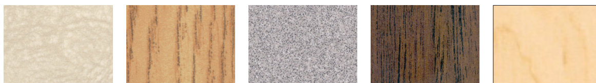
AMANDE ROSÉ (AR) CHÊNE (CH) GRIS SPECTRUM (GS) NOYER (NO) ÉRABLE (ER)